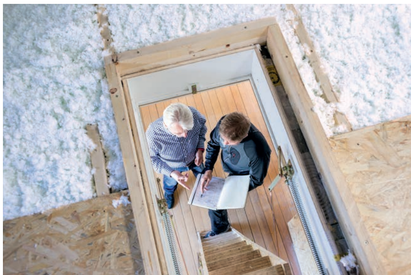
Verarbeitung von ISOVER InsulSafe auf der obersten Geschoßdecke

ISOVER InsulSafe ist die flexible Lösung für die Dämmung der obersten Geschoßdecke. Sie wird freiliegend auf dem Dachboden aufgeblasen oder raumausfüllend in Deckenkonstruktionen eingebracht und garantiert durch ihre Setzungssicherheit gleichbleibende Dämmleistung bei Neubau und Sanierung.