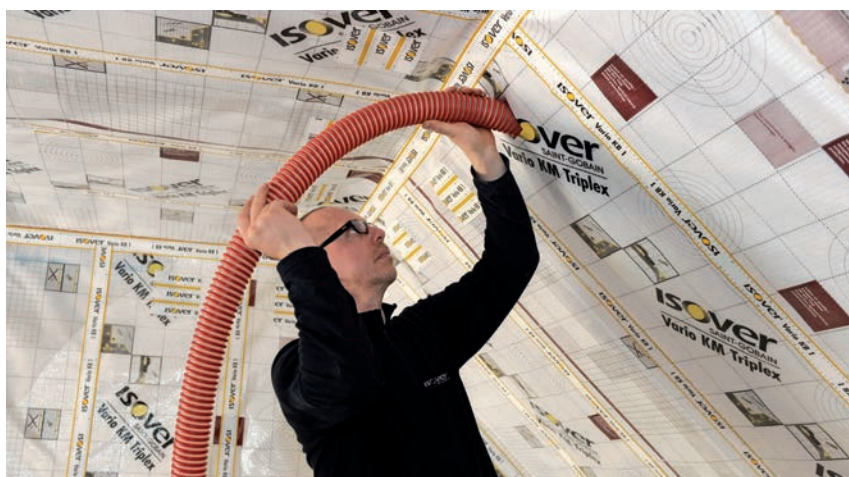
Verarbeitung von ISOVER InsulSafe im Steildach und in der Holzriegelwand

ISOVER InsulSafe wird sauber und schnell über Schläuche in Hohlräume zwischen Deckenbalken, Dachsparren und in Holzrahmenwände eingebracht. Die fugenlose und rieselfreie Verarbeitung verhindert Wärmebrücken und beugt so Feuchteschäden, Energieverlust und sommerlicher Überhitzung vor.